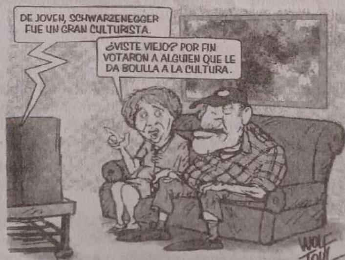
Por Wolf Tout.

Determinados sectores sociales tienen la capacidad de construir un discurso que ordena los lazos sociales, da sentido histórico a las percepciones, los afectos y los juicios. Estos discursos sociales se naturalizan, circulan, y permiten revestir de sentido al mundo.