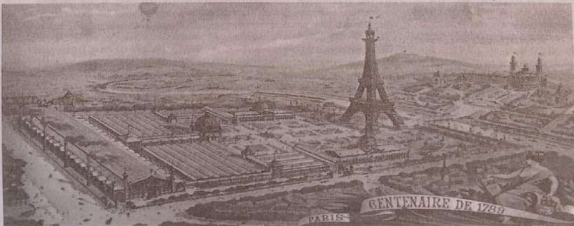
La Torre Eiffel, un triunfo de la ingeniería construido para la Exposición de París de 1889.

La teoría social surge entonces con una pretensión científica: explicar los cambios sociales que se produjeron en la época de transición hacia la nueva sociedad industrial.